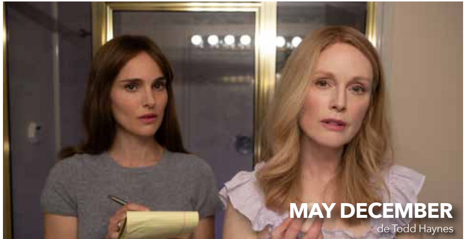
MAY DECEMBER de Todd Haynes